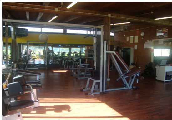
2 palestre climatizzate di 90 e di 60 mq