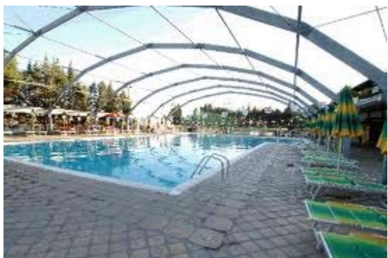
1 piscina semi olimpionica 25 x 12,50 coperta - riscaldata -